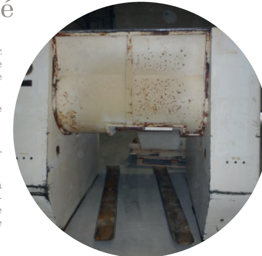
Pièce avant décapage

A Courcelles, les clients de l'aéronautique, les constructeurs d'engins lourds, les fabricants du secteur agroalimentaire ou encore les transformateurs du plastique reviennent depuis le début de l'année 2010 avec des volumes de pièces à découper plus conséquents.